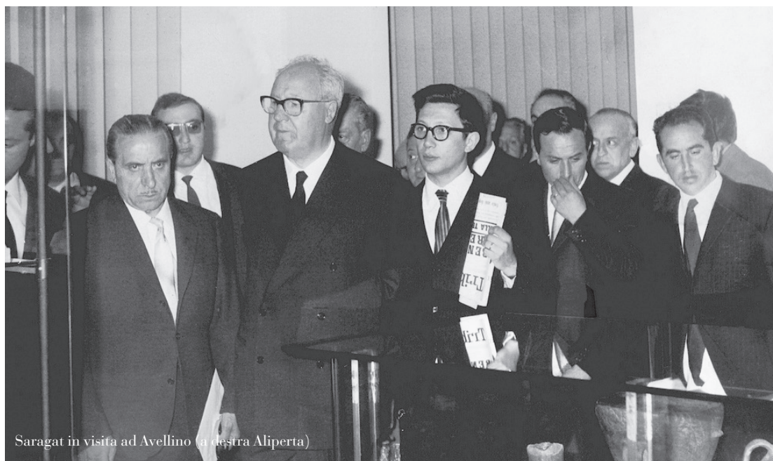
Saragat in visita ad Avellino (a destra Aliperta)

riedificazione delle zone terremotate con uno stanziamento di 210 miliardi di lire.