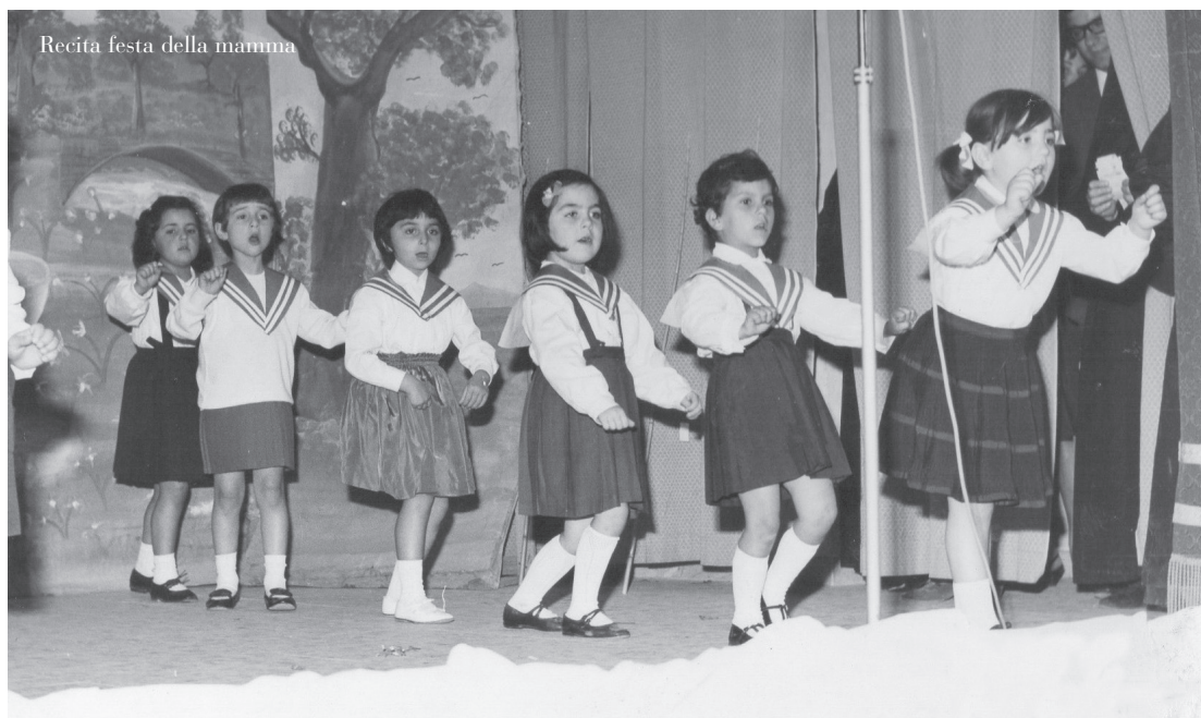
Recita festa della mamma

17 maggio – In occasione della Festa della Mamma appena trascorsa, i bambini della scuola elementare Sant'Anna delle Suore Francescane D'Egitto mettono in scena un'allegria recita quale dono alle loro mamme.