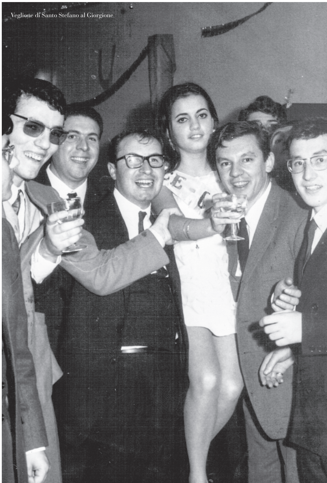
Veglione di Santo Stefano al Giorgione