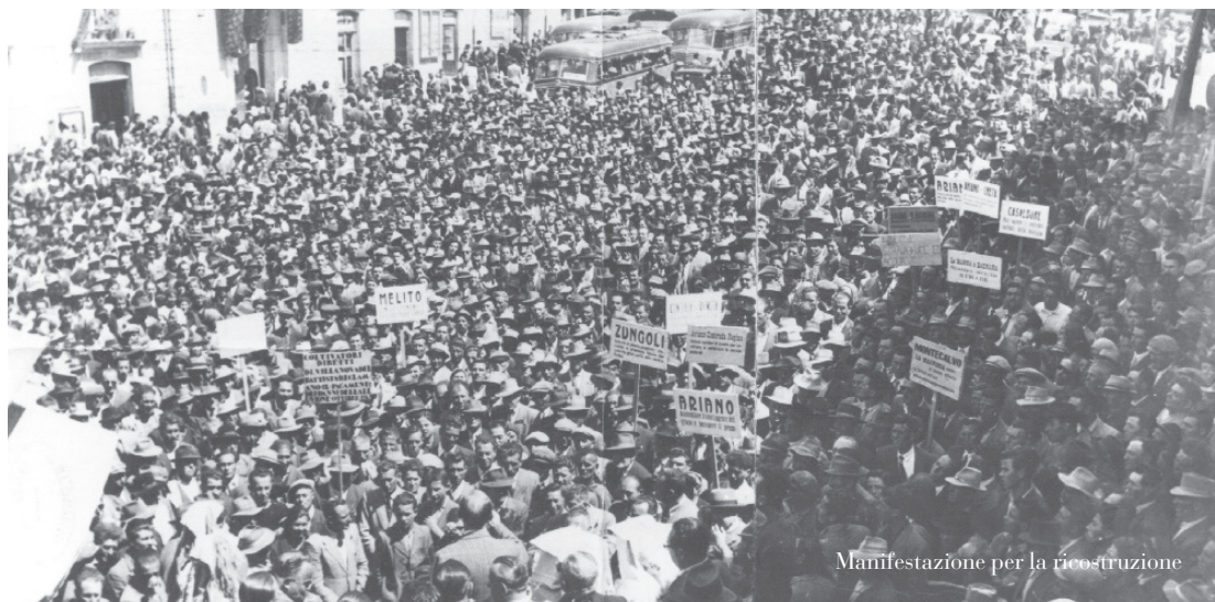
Manifestazione per la ricostruzione

3 aprile – Vibrata protesta della Città per lo stallo che sta vivendo la ricostruzione a causa degli inadeguati finanziamenti statali. Consiglio comunale permanente dalle 9,00 alle 24,00, serrata dei negozi e corteo per le strade con comizio finale. Presente il Presidente della Provincia Raffaele Ingresani ; assente il Senatore Enea Franza dell' MSI impegnato a Roma nella Commissione Tesoro. Sostegno dei sindacati all'iniziativa. Verrà inviato anche un telegramma al Presidente della Repubblica e a tutti i componenti del Governo per rappresentare la protesta e sollecitare l'arrivo dei fondi. Viene sottolineata la situazione drammatica dei cit-