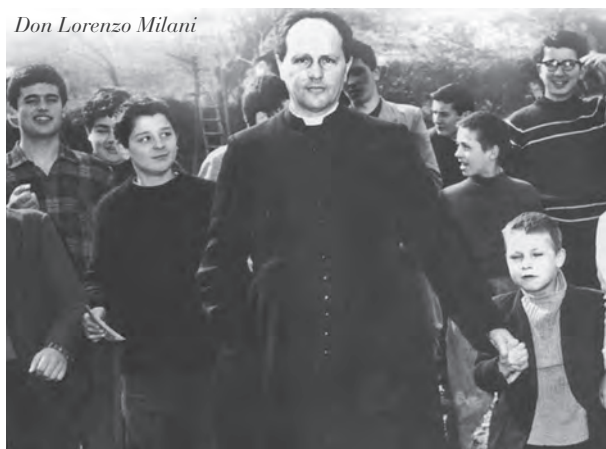
Don Lorenzo Milani

15 febbraio - Scoppia il caso di Don Lorenzo Milani . Il Parroco di Barbiana sul Mugello, aveva più volte difeso i promotori del movimento obiettori di coscienza e questo proprio mentre divampavano le contestazioni per la guerra americana nel Vietnam che sta mettendo in crisi di coscienza molti cristiani. Un cappellano