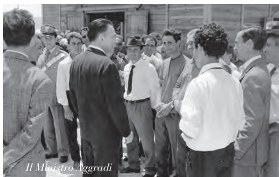
Il Ministro Aggradi

8 giugno - La “merenda” offerta al Ministro dell'Agricoltura Mario Ferrari Aggradi in occasione della sua visita il 3 e