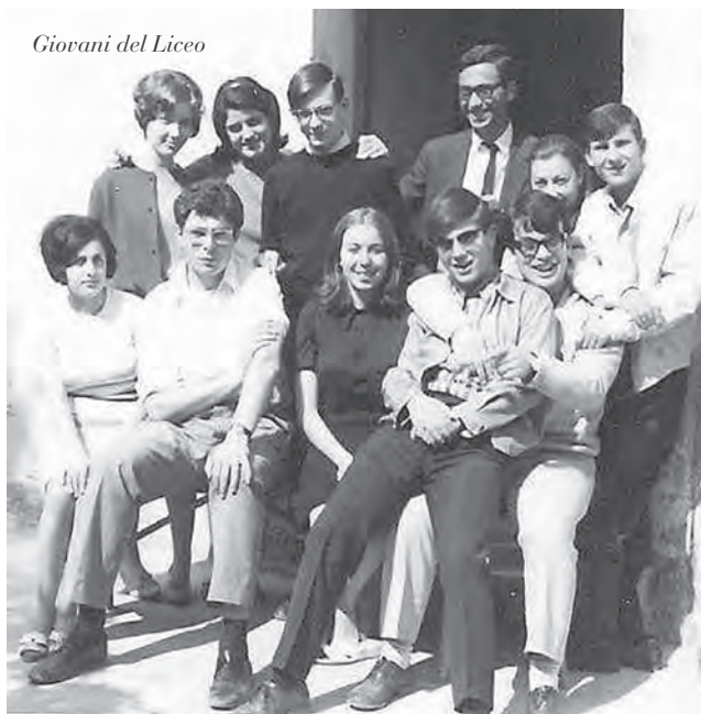
Giovani del Liceo

stratori, ai gruppi politici (vedi foto copertina). Dunque la ricostruzione prosegue a rilento; quella pubblica va meglio di quella privata impantanata nell'utopia dei "comparti". Si lavora per gli edifici scolastici, il tribunale, l'ufficio postale. Prendono inizio i tanto attesi lavori di costruzione della strada di collegamento tra piazza Duomo e la piazza antistante la chiesa di Sant'Angelo (oggi corso Europa). Inizia anche la demolizione del vecchio municipio. Si discute su dove far sorgere il casello autostradale. Il numero di poveri è in leggera flessione: 660 capofamiglia iscritti nell'elenco degli indigenti rispetto ai 738 del 1965. La vicenda della