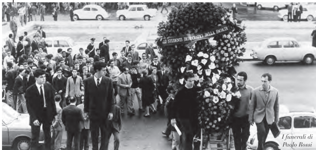
I funerali di Paolo Rossi

30 aprile - Gianni Agnelli , 45 anni, è il nuovo presidente della FIAT . Vittorio Valletta , 83 anni, viene nominato presidente onorario a vita. Esce di scena l'uomo che ha guidato la Casa torinese internazionale nei suoi strepitosi successi dal 1921 in poi.