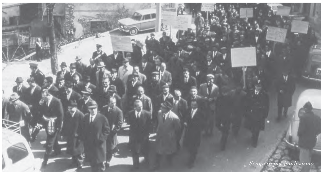
Sciopero per fondi sisma

dal Genio Civile ma ancora pendenti. Il Senatore fa cenno anche alla “marcia dei terremotati” promossa di recente dai partiti politici.